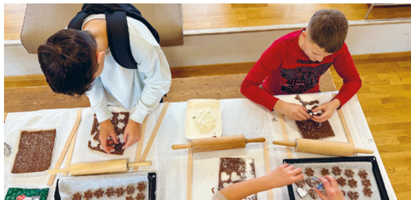
Guetzli-Späss mit den Kids.

decken kann. Für die Besucherinnen und Besucher halten wir heisse und kalte Getränke sowie kleine Snacks bereit. Zudem möchten wir für eine stimmungsvolle Atmosphäre unsere Feuerschale entzünden. Der Anlass bietet allen Einwohnerinnen und Einwohnern die Gelegenheit, unseren Treff kennenzulernen, mit der Leitung ins Gespräch zu kommen, Fragen zu stellen und den Jugendlichen in ihrem eigenen Raum zu begegnen. Unsere Türen stehen auch offen für alle, die einen Einblick in unser Angebot erhalten möchten. Wir hoffen auf winterliches Wetter – auf Schnee und einen sternklaren Himmel –, damit man auch draussen am Feuer verweilen und miteinander ins Gespräch kommen kann. Das Jugendhaus (ehemals Schützenhaus) an der Schützenstrasse ist gut zu Fuss erreichbar. Wir freuen uns auf Ihren Besuch und wünschen Ihnen schon jetzt eine erfreute Adventszeit.