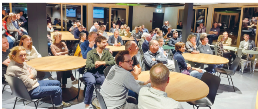
Die Anwesenden während der Vorstellung von CHRIS sports AG

CHRIS sports AG ist ein fachhandelsorientierter Anbieter von hochwertigen und innovativen Marken im Sport-, Bike- und Lifestyle-Segment. Die Geschichte begann 1989 in Chrigel's Garage und wird nun in Eschlikon am neuen Hauptsitz weitergeführt (chrisports.ch).