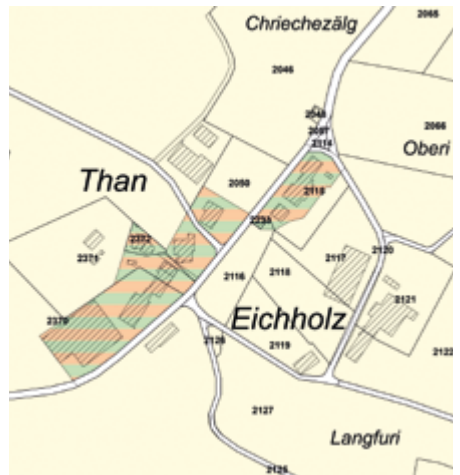
Abb. 2: Ausschnitt Than

Zusätzlich wird die Kleinsiedlung «Than» neu einer Erhaltungszone zugewiesen (Nicht-Bauzone). Nachfolgende Ausschnitte aus dem neuen Zonenplan zeigen die Zuweisung dieser Gebiete auf.