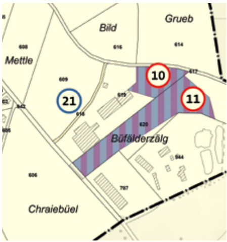
Abb. 4: Ausschnitt Büfälderzälg

Im Gebiet Büfälderzälg werden bereits genutzte Flächen von der Landwirtschaftszone in die Arbeitszone Gewerbe 2 eingezont (vgl. Abb. 4: Nr. 10 und 11).