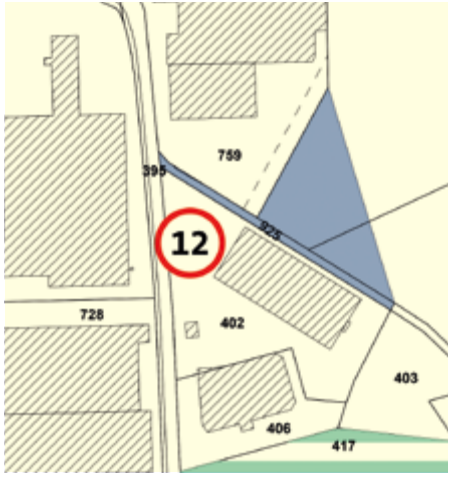
Abb. 5: Ausschnitt Hörnlistrasse

Im Gebiet an der Hörnlistrasse wird für die Betriebserweiterung eine Fläche von der Landschaftsschutzzone sowie der Verkehrsfläche innerhalb Bauzone in die Arbeitszone Industrie eingezont (vgl. Abb. 5: Nr. 12).