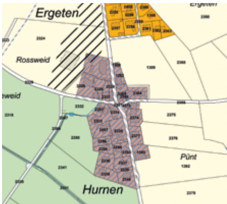
Abb. 1: Ausschnitt Hurnen

Aufgrund der Änderung des kantonalen Richtplans im Bereich der Kleinsiedlungen, sind die in Eschlikon vorhandenen Weilerzonen nicht mehr zulässig. Aus diesem Grund wird das Gebiet Hurnen von der Weilerzone in die Dorfzone umgezont.