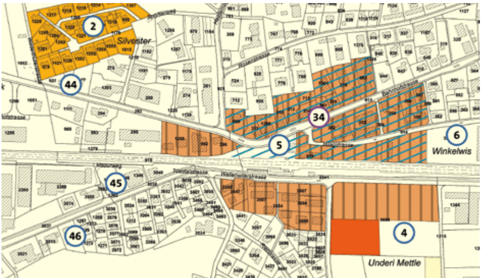
Abb. 3: Ausschnitt Bahnhofareal Eschlikon

beleben und eine höhere Dichte an zentraler Lage zu erreichen. An den besonders exponierten Stellen im Zentrum und im Mitteldorf wurden Gestaltungsplanpflichten erweitert resp. neu festgelegt.