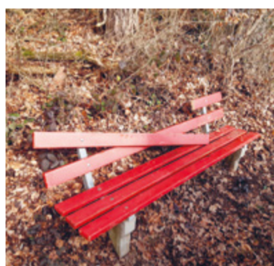
Zerstörtes Gemeindebänkli - dafür braucht es mehr als ein Sackmesser.