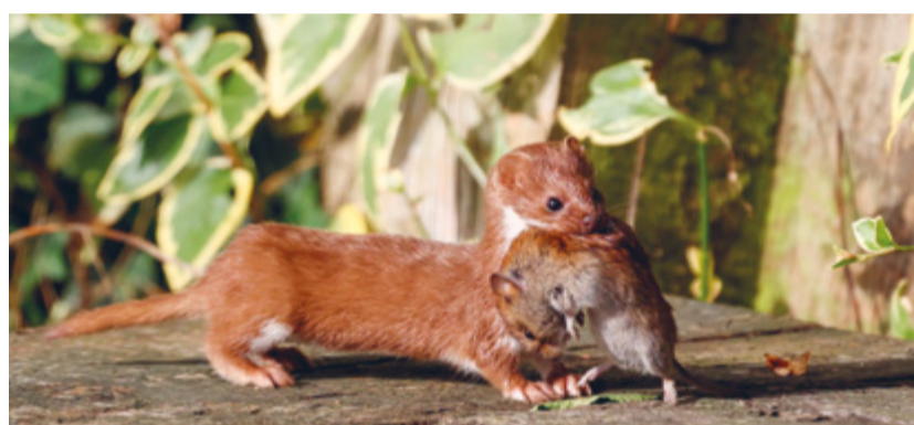
Wiesel ernähren sich von Mäusen und sind wertvolle Mitarbeiter in der Landwirtschaft.