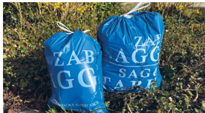
Bereits am Strassenrand zu sehen – der neue blaue Gebührensack des ZAB.

Im Einzugsgebiet des ZAB haben die Einwohnerinnen/Einwohner mit dem KUH-Bag die Möglichkeit, Kunststoffverpackungen nicht im Kehricht, sondern separat zu entsorgen. Damit können Kreisläufe geschlossen, natürliche Ressourcen geschont und die CO2-Belastung reduziert werden.