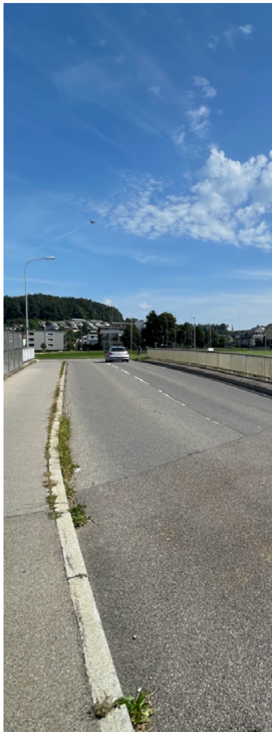
Das grösste Investitionsprojekt 2024 ist die Sanierung der Hörnlibrücke zur Erhöhung der Verkehrssicherheit.

Das grösste Investitionsprojekt 2024 ist die Sanierung der Hörnlibrücke, welche zur Erhöhung der Verkehrssicherheit verbreitert und saniert wird. Mehr Informationen zum Projekt finden Sie ebenfalls auf der Seite 31.