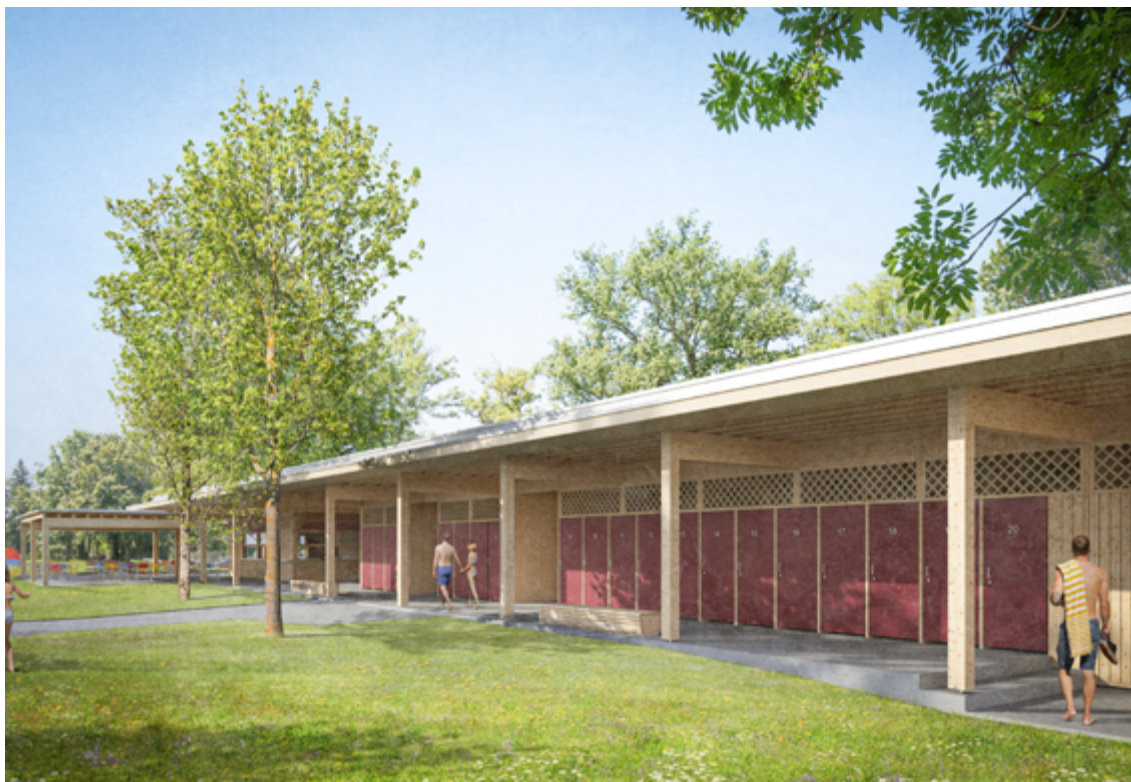
Abbildung: Blick aus der Badi in Richtung Südwesten auf den Neubau mit überdachtem Laubengang. Mietkabinen und Zugänge zu Toiletten und Garderoben.

Die Eingangshalle trennt das Gebäude in einen südlichen Teil mit Kasse und Gastronomie sowie einen nördlichen Teil, welcher die bestehende Technik sowie den Garderobenbereich beherbergt. Der Garderobenbereich ist zum Vorplatz geschlossen und öffnet sich zur Badi hin mit einem ausladenden Vordach. An der Aussenfassade in Richtung Parkbad liegen die Mietkabinen.