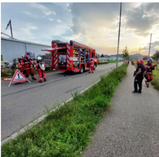
2. Angriffsübung vom 16. August 2023 der Feuerwehr Eschlikon in Kooperation mit der SBB.

Nach heutigem Stand wird dadurch zukünftig der Feuerschutz für rund 31'000 Einwohner durch den Verbund sichergestellt. Die Feuerwehrdepots werden, wie bisher ausgestattet mit Fahrzeugen, Material und Feuerwehrleuten, in den Gemeinden verbleiben, damit die Vorgabe, jeden Brandort innert 10 Minuten zu erreichen, eingehalten werden kann. Hingegen werden durch die Anstellung eines regionalen Geschäftsführers Synergien im Bereich Aus- und Weiterbildung, Führung, zur Adaption der steigenden Anforderungen an Materialnormen und in