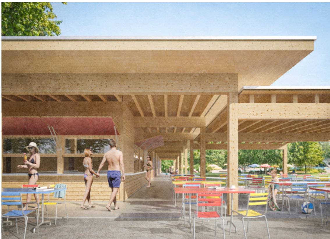
Abbildung: Blick aus der Badi in Richtung Norden auf den neuen Gastronomiebereich mit grosszügiger Ausgabe und überdachten Sitzgelegenheiten.

In den Jahren 2024 bis 2039 leisten die beteiligten Gemeinden jährliche Amortisationsbeiträge (Beiträge abnehmend), d.h. total CHF 4'030'000.00. Hinzu kommen Zinsen von rund CHF 814'200.00 (indikativ). Der Gesamtbetrag von CHF 4'844'200.00 wird wie folgt auf die Gemeinden aufgeteilt: