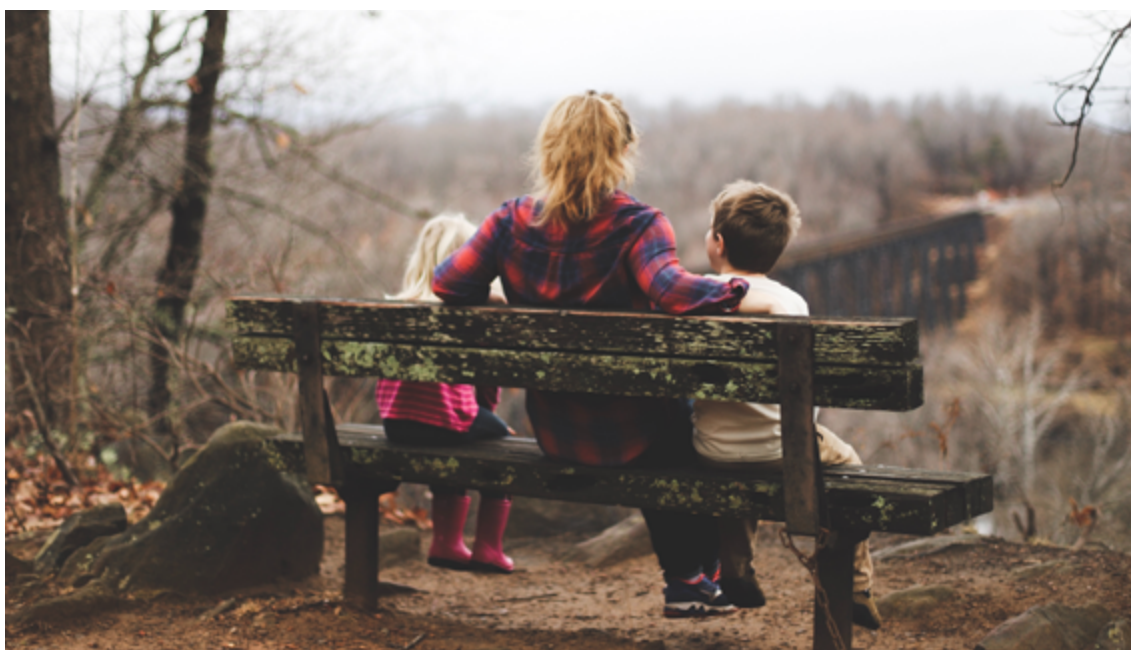
Bedarf nach Familienberatung steigt stetig.

Unser Dorfleben ist geprägt von den aktiven Vereinen. Nach einem ungewollten Unterbruch konnten die turnenden Vereine ihre zahlreichen Talente in der sanierten Mehrzweckhalle Bächelacker vortragen. Auch andere Vereine werden im neuen Jahr ihren Beitrag für ein gelebtes Eschlikon leisten. Hinter diesen Aktivitäten stehen Macherinnen und Macher, welche sich ehrenamtlich für den Verein einsetzen. Herzlichen Dank für das Engagement und viel Power für die zahlreichen Vorhaben im neuen Jahr.