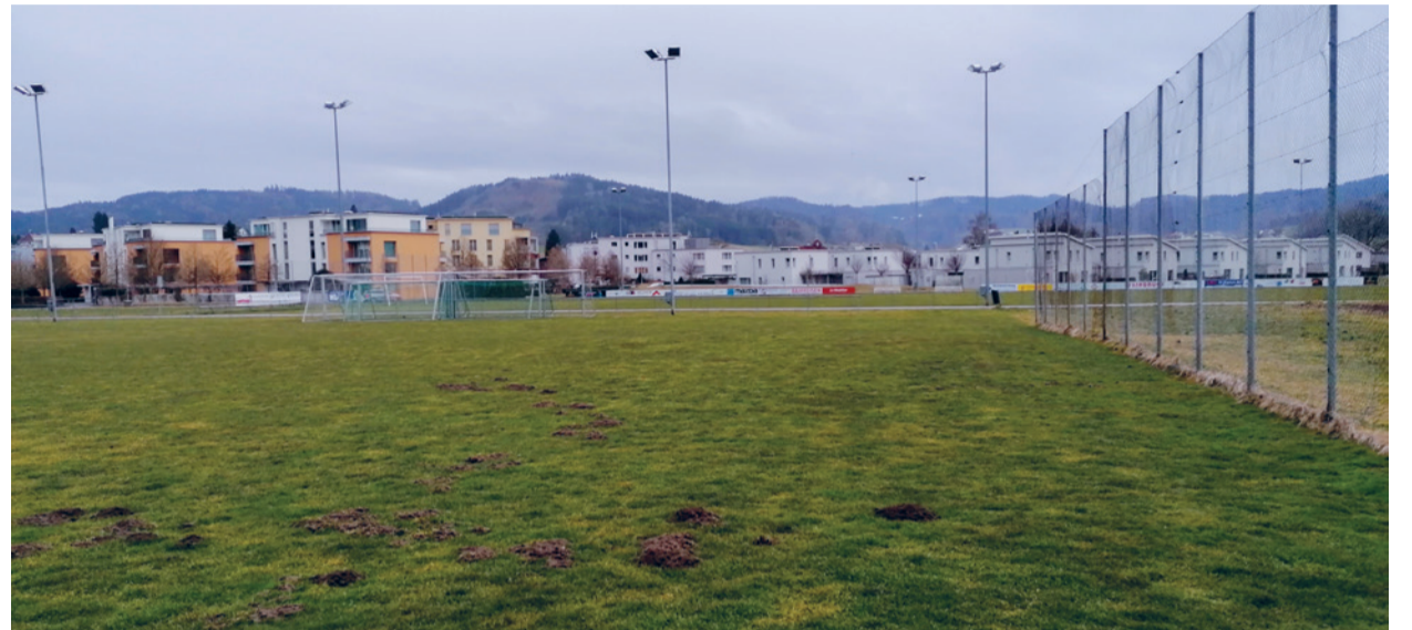
50 Jahre Fussballspielfeld haben ihre Spuren hinterlassen – den Mäusen gefällt's, den Spielenden nicht ...

Die beiden Fussballplätze des FC Eschlikon wurden vor bald 50 Jahren angelegt