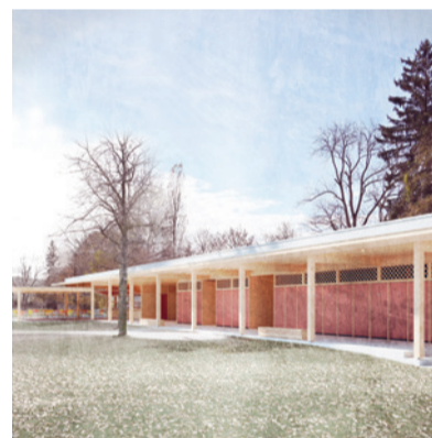
Parkbad an der Murg

Das Parkbad an der Murg leistet einen wichtigen Teil an die Freizeitinfrastruktur in unserer Region, so auch für unsere Gemeinde. Der Gemeinderat hat daher beschlossen, den Stimmbürgerinnen und Stimmbürgern anlässlich der Gemeindeversammlung vom 30. November eine Mitfinanzierung analog früherer Investitionen zur Genehmigung vorzulegen. Die Investitionen werden durch die Genossenschaft über ein Bankdarlehen finanziert und in der Folge während 15 Jahren durch die beteiligten Gemeinden amortisiert und verzinst. Für die