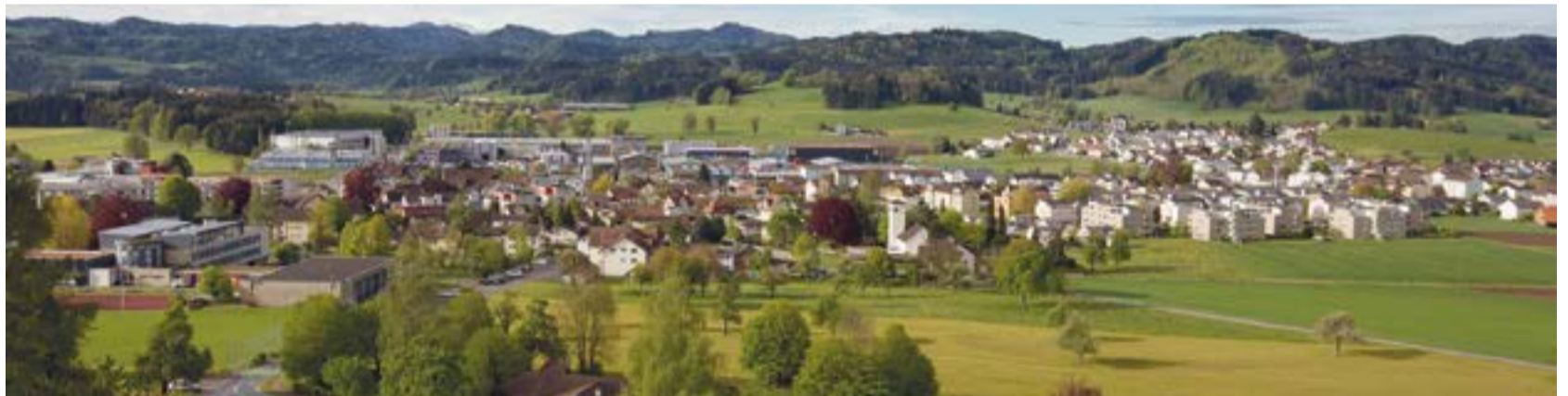
Eschlikon im Umbruch - Der Gemeinderat schlägt eine Reform der Gemeindeordnung vor.

Ein Wort noch zur alten Gemeindeordnung. Wer diese aufmerksam liest entdeckt viele begriffliche Unklarheiten. Was ist beispielsweise eine Behörde, was ein Organ der Gemeinde? Die Verwaltungsführung ist in Art. 41 dem Gemeindepräsidenten übertragen, in Art. 42 steht hingegen: «Dem Gemeindeschreiber oder der Gemeindeschreiberin obliegen ... die Führung der Gemeindeverwaltung». Allein aus diesen Gründen ist eine Überarbeitung des Regelwerkes aus dem Jahre 2002 angezeigt.