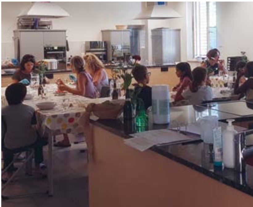
Die Familienergänzende Tagesbetreuung startete mit dem neuen Schuljahr.

Die ersten Wochen stehen ganz im Zeichen des Kennenlernens und des Eingewöhnens. Neue Personen, neue Räume und ganz viele Eindrücke müssen verarbeitet und eingeordnet werden. Was gleich bleibt ist das schmackhafte und ausgewogene Essen des bewährten Mittagstischteams, welches neu im Haldenweg kocht.