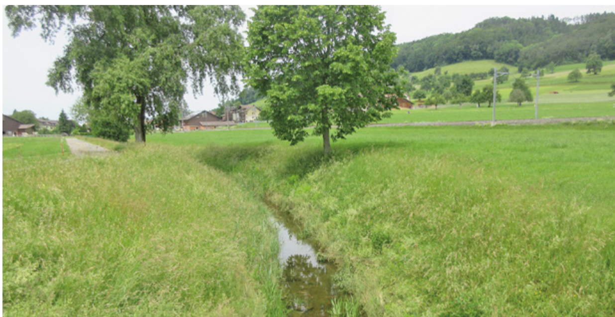
Der Bahngraben in Eschlikon ist Teil des GEP.

Fremdwasser: Der Fremdwasseranteil im Einzugsgebiet der ARA Lützelmurgtal ist grösser 30 Prozent. Das heisst ein Drittel des Trockenwetteranfalls auf der ARA ist Sauberwasser und verursacht unerwünschte Kosten bei der Abwasserbehandlung auf der ARA.