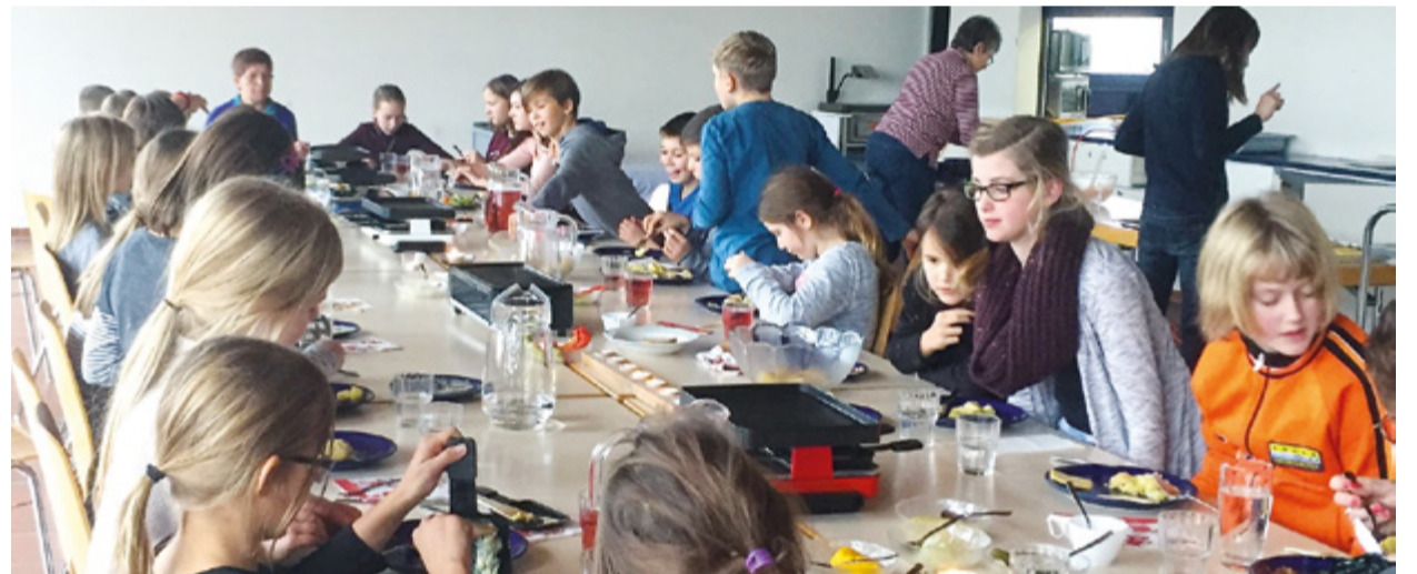
Der bereits bestehende Mittagstisch wird in die Tagesstruktur integriert.

Stellenausschreibung auf www.eschlikon.ch sowie auf Crossiety.