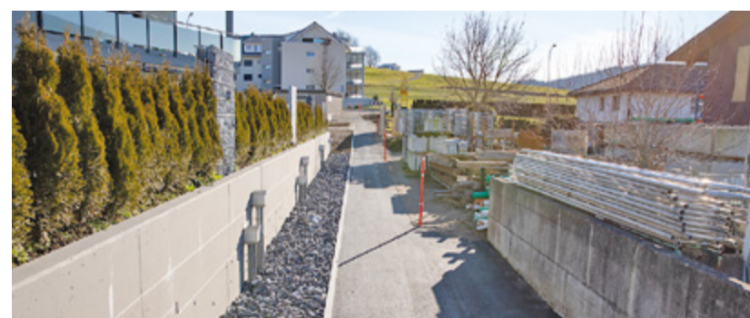
Wo früher ein Trampelpfad war, ist heute der neue Fussweg.

räumen. Somit konnte die Gemeinde entlang des neuen Mehrfamilienhaus Ehrmerk 8 zur Kantonsstrasse Richtung Balzerswil einen Verbindungsweg realisieren. Im gleichen Zeitraum wurden im Zusammenhang mit der Erweiterung des Fernwärme-Netzes der Energie Münchwilen AG, die Fusswegverbindung von der Bahnhof- zur Rosenstrasse und der Rennweg mit einem neuen Belag versehen. Wo für die Fussgängerinnen und Fussgänger in den vergangenen Wochen einige Hindernisse vorhanden waren, ist somit wieder freier Durchmarsch möglich.